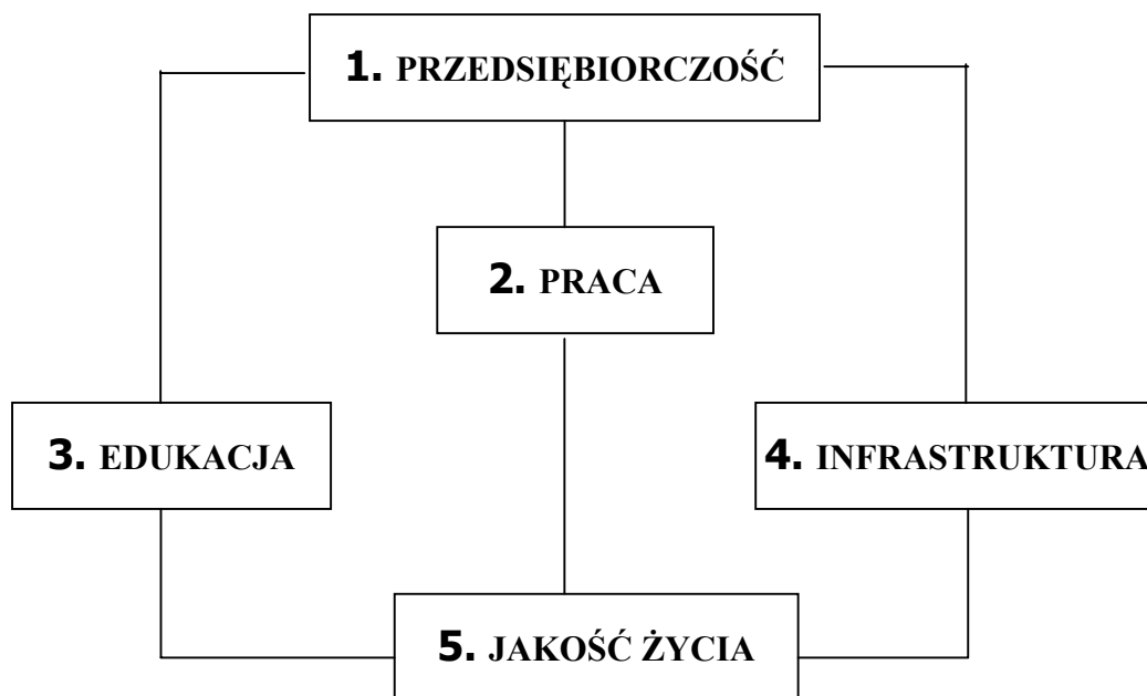
Rysunek 2. Pięć programów zawartych w Strategii Rozwoju Województwa Wielkopolskiego

W realizacji zadań są przyjęte trzy następujące przesłanki: